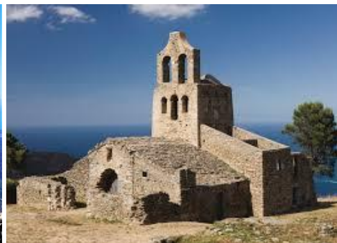
Église de Santa Elena