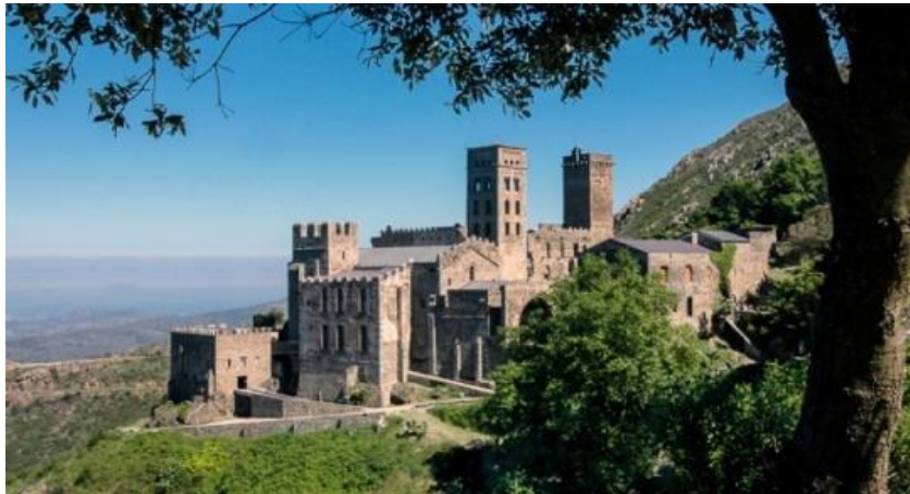
Monastère de Sant Pere de Rhodes