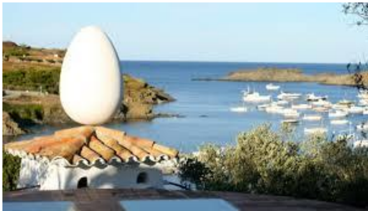
Baie de Port Lligat