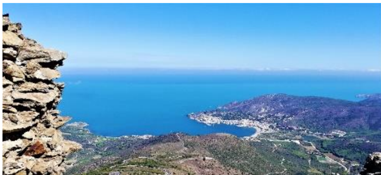
Vue depuis le château de Saverdera