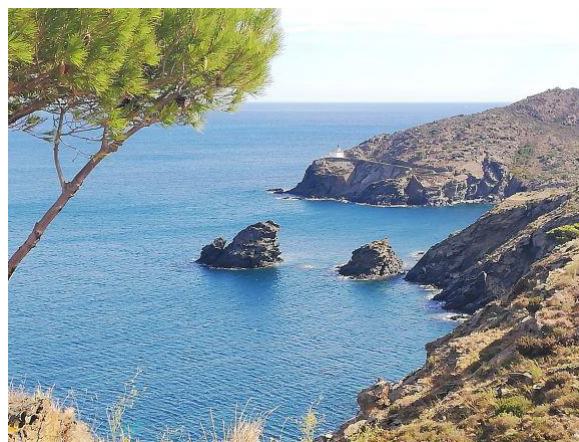
Phare de Cala Nans