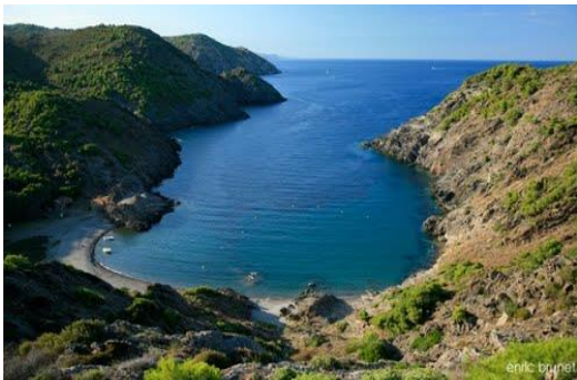
Crique de Cadaqués