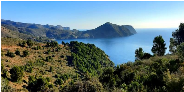
Vue panoramique du Cap Norfeu